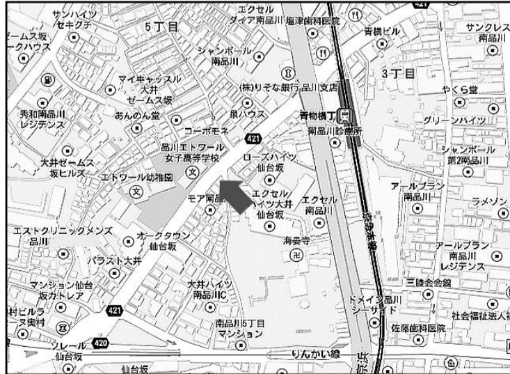
～ 品川エトワール女子高等学校試験場 ～