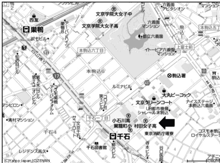
～ 村田女子高等学校試験場 ～